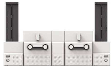
smart 70 Whatever you want or need!