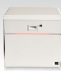
SwiftLaser Módulo online de grabado láser