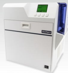
K65&K65D Impresión retransfer alta definición 600 ppp