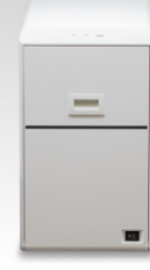
L10&L10D Laminación online 1 cara / 2 caras